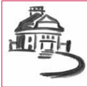
Förderverein Schloss und Gutshof Börnicke e.V.