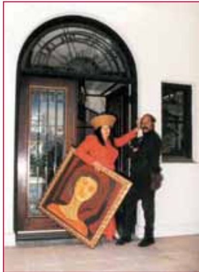
„Lady between the Lines“, Quelle: Monticello Miller

Namensgeber ist der Künstler Monticello Miller. Er malt ausschließlich Frauenbilder: Ladys.