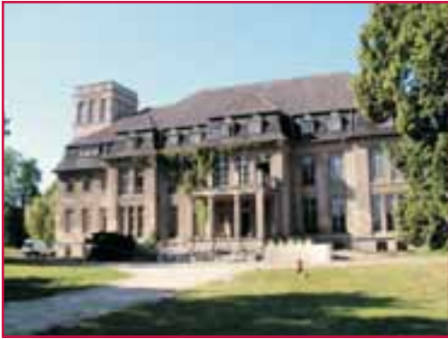
Schloss Börnicke 2004