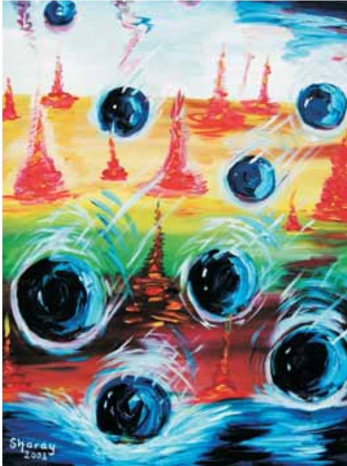
Sharay 2003, „Fremde Welten...?!“, Eröffnungsbild 2005