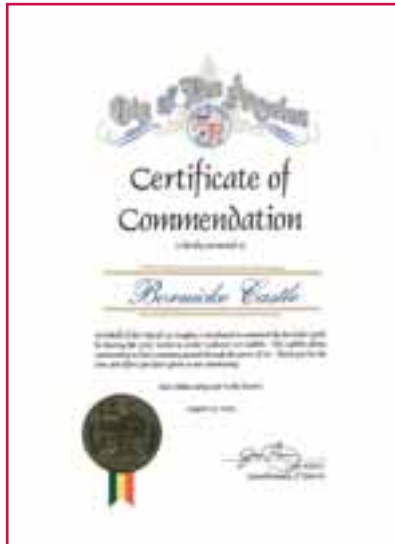
Stadt Los Angeles, Schreiben für „Artists to Artists Germany 2005“

Die Umsetzung des Internationalen Künstlertreffens bedarf zahlreicher Förderer für die Finanzierung. Es ist dem Förderverein und der Künstleragentur gelungen, einen Großteil der finanziellen Mittel einzuwerben.