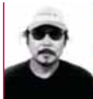
JUNG KOOK BYUN