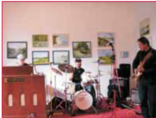
Schloss Börnicke Ausstellung und Jazz-Konzert 2004

2004 organisierte der Förderverein folgende Veranstaltungen: