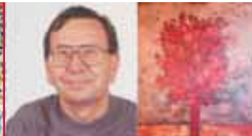
FRANÇOIS DE VERDIÈRE